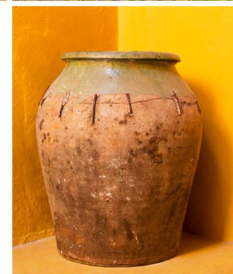
Linker- en deze pagina: interieur en exterieur van gastenverblijf La Ruina.