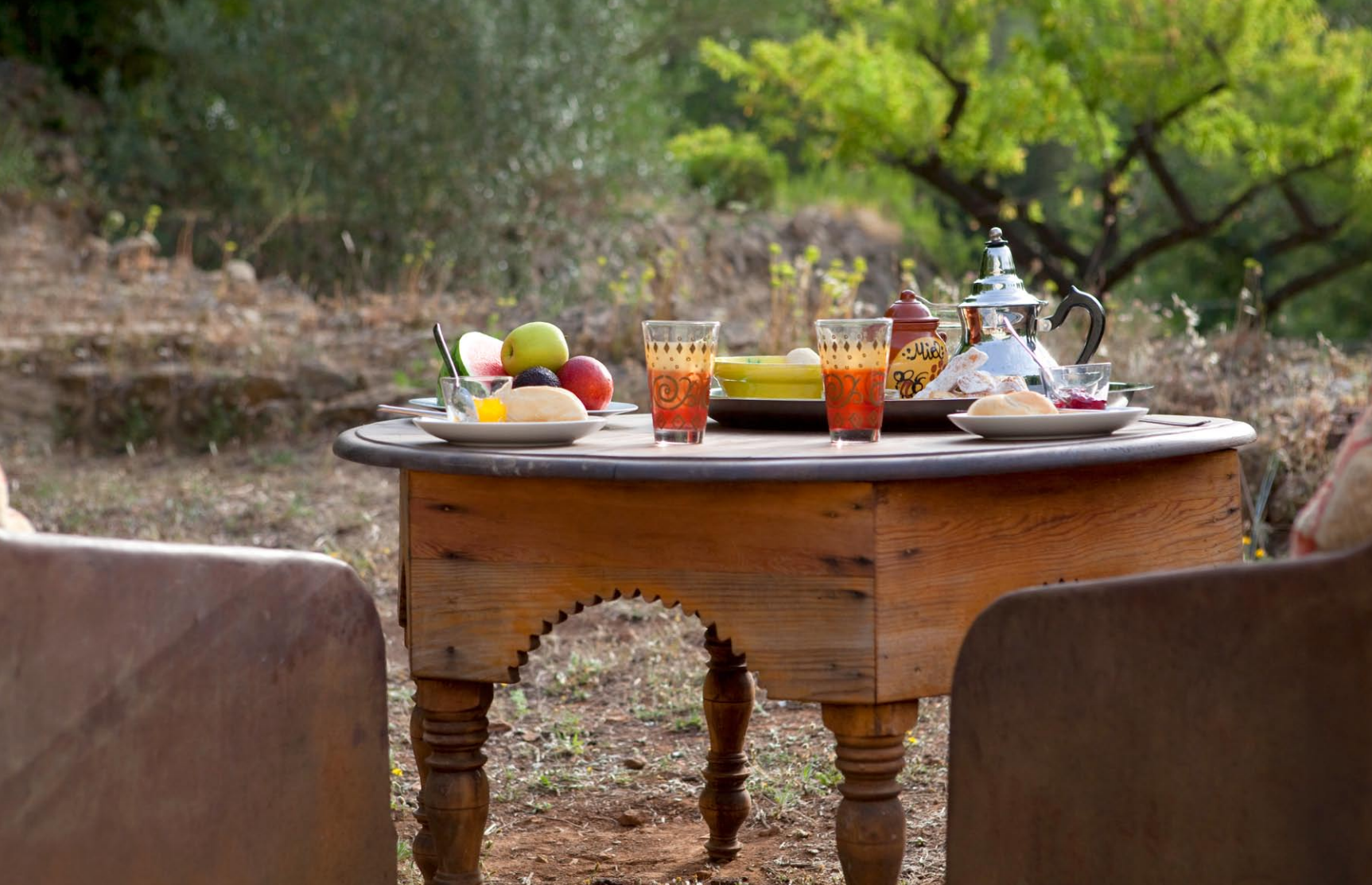
In La Jaima, de Marokkaanse berbertent, waan je je in een Duizend-en-een-nacht-sprookje.